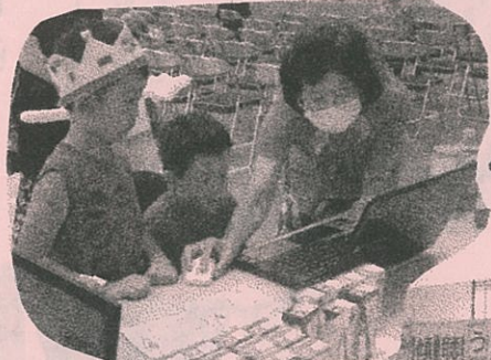
パソコンで 健康チェック!