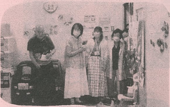
おまち図書館 の見学