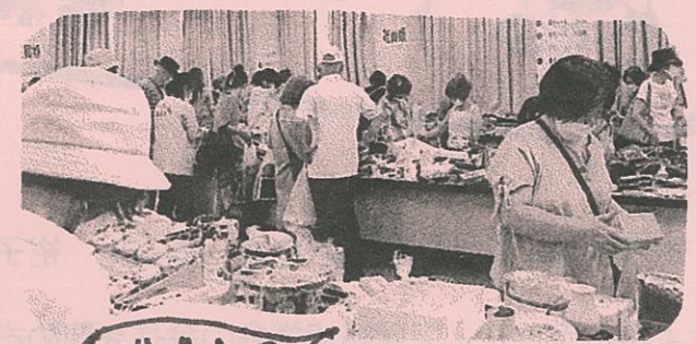
バザー会場 掘り出し物を ゲットしよう!