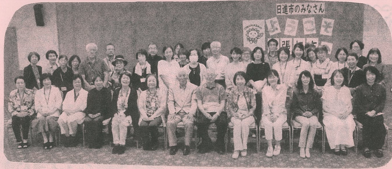
日進市のみなさん

日進市ボランティアの皆さんが、 尾張旭市ボラ連とボランティアセンターを 視察！(6月8日)