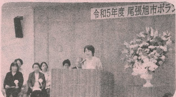
令和5年度 尾張旭市ボラ