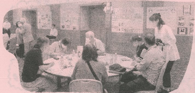
グループ別に 6つのテーブルで 両市ボランティア の交流