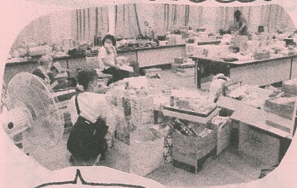
前日・値付け “縁の下の力持ち” ご苦労様です!