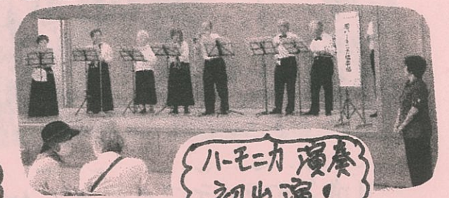
ハモニカ演奏 初出演!