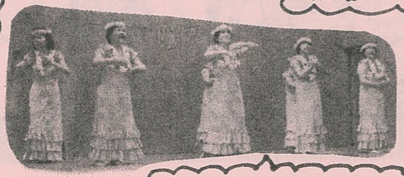
ハワイのメロディとダンス 癒やされます〜