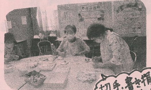
切手、書き損じ ハガキなどの収集