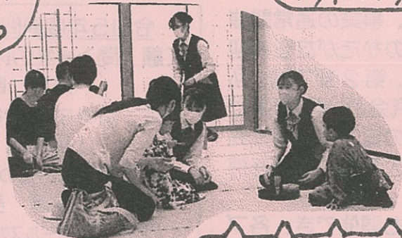
お点前の体験、子ども達も興味津々!!