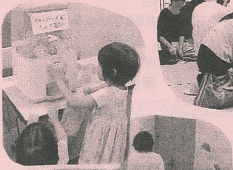
手作りおもちゃは手にやさしい〜♡