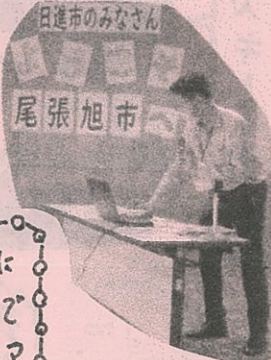
ボラ連とボランティア センターについて、パワー ポイントで説明