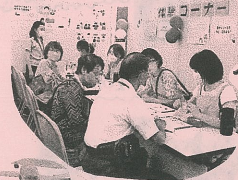
障がい者正しく 理解しよう!!