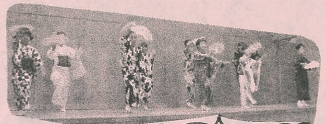
和服姿の子ども達、キマッテル!