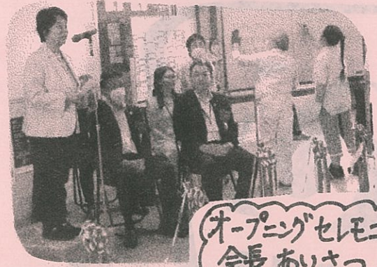
オープニングセレモニー 会長あいさつ