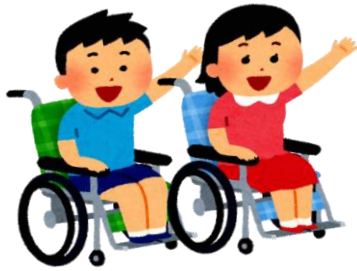
す おわりあさひし