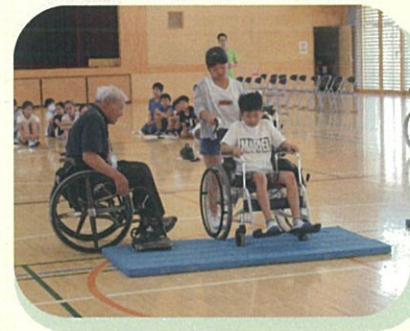
学校での福祉教育