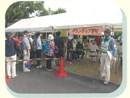
大規模災害時のボランティア活動支援