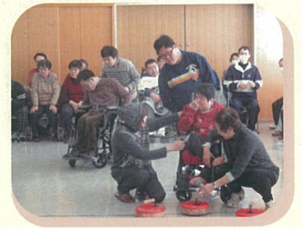
障がいのある方のために