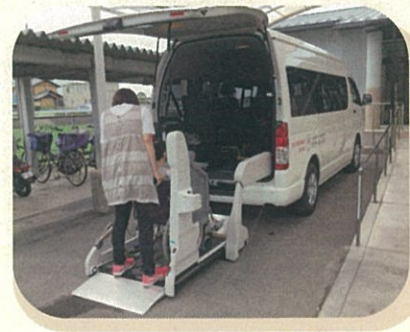
福祉施設の車両整備

赤い羽根共同募金は、高齢者、障がい者、子どもたちへの地域の福祉活動を支援する募金です。災害時には、被災地支援にも役立っています。